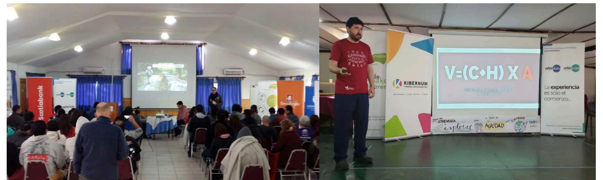
Pendón en Salón Principal