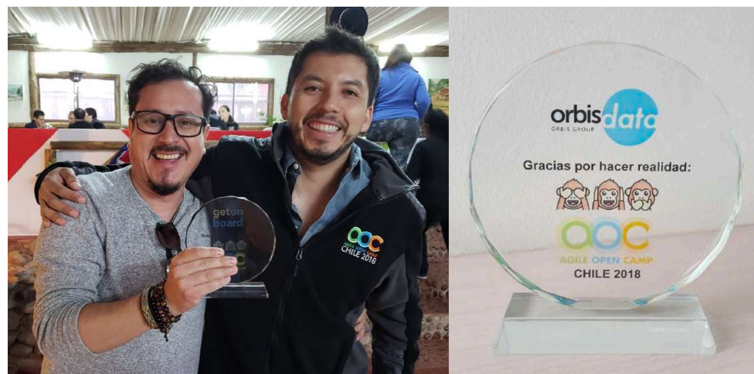
Estatuilla de participación como Sponsor