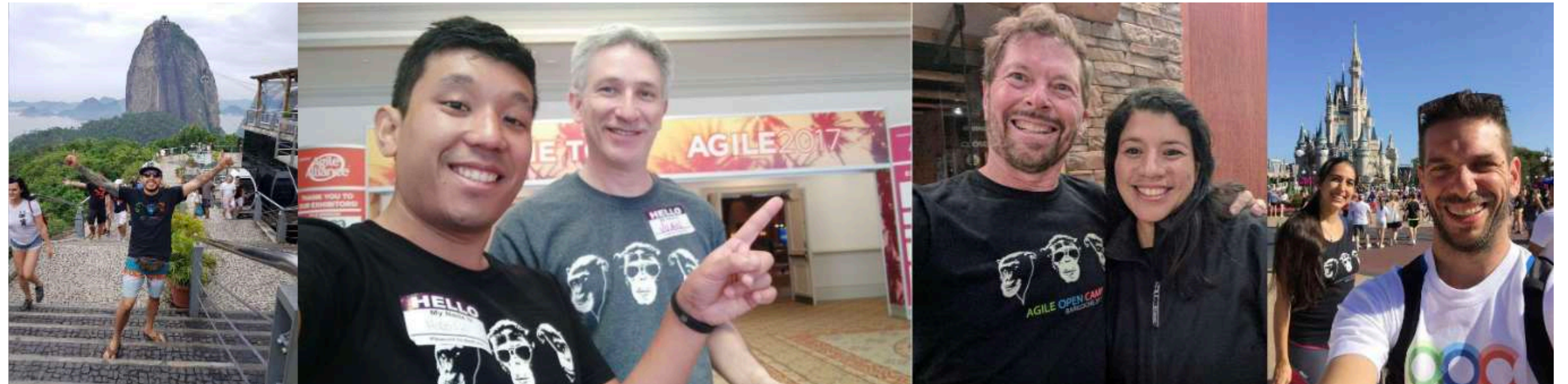
La polera más viajera de la agilidad