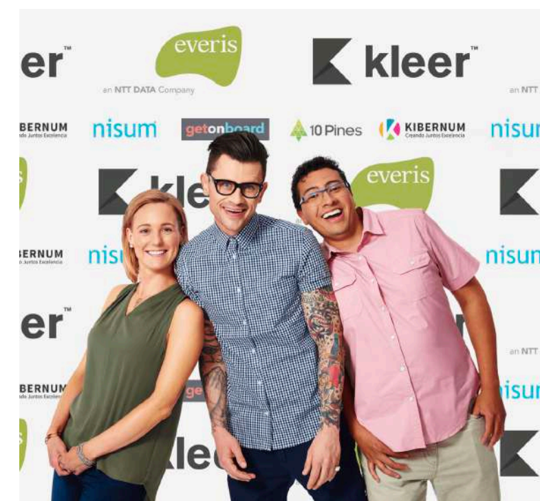
Fondo con logos para fotos oficiales